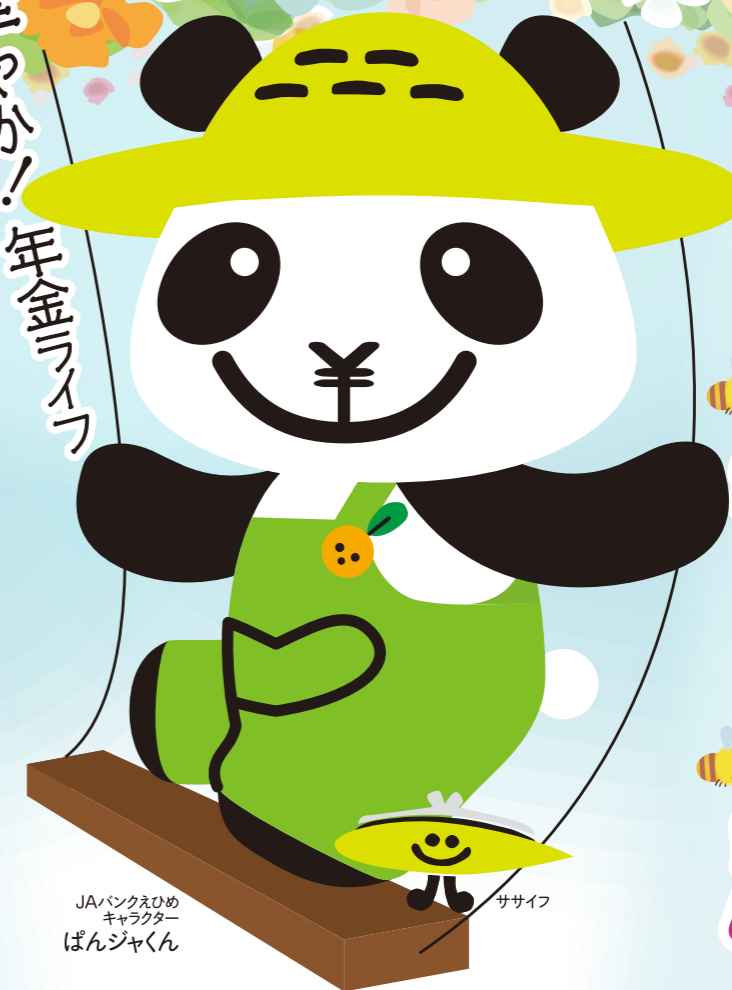
JAバンクえひめキャラクター ぱんじゃくん ササイフ